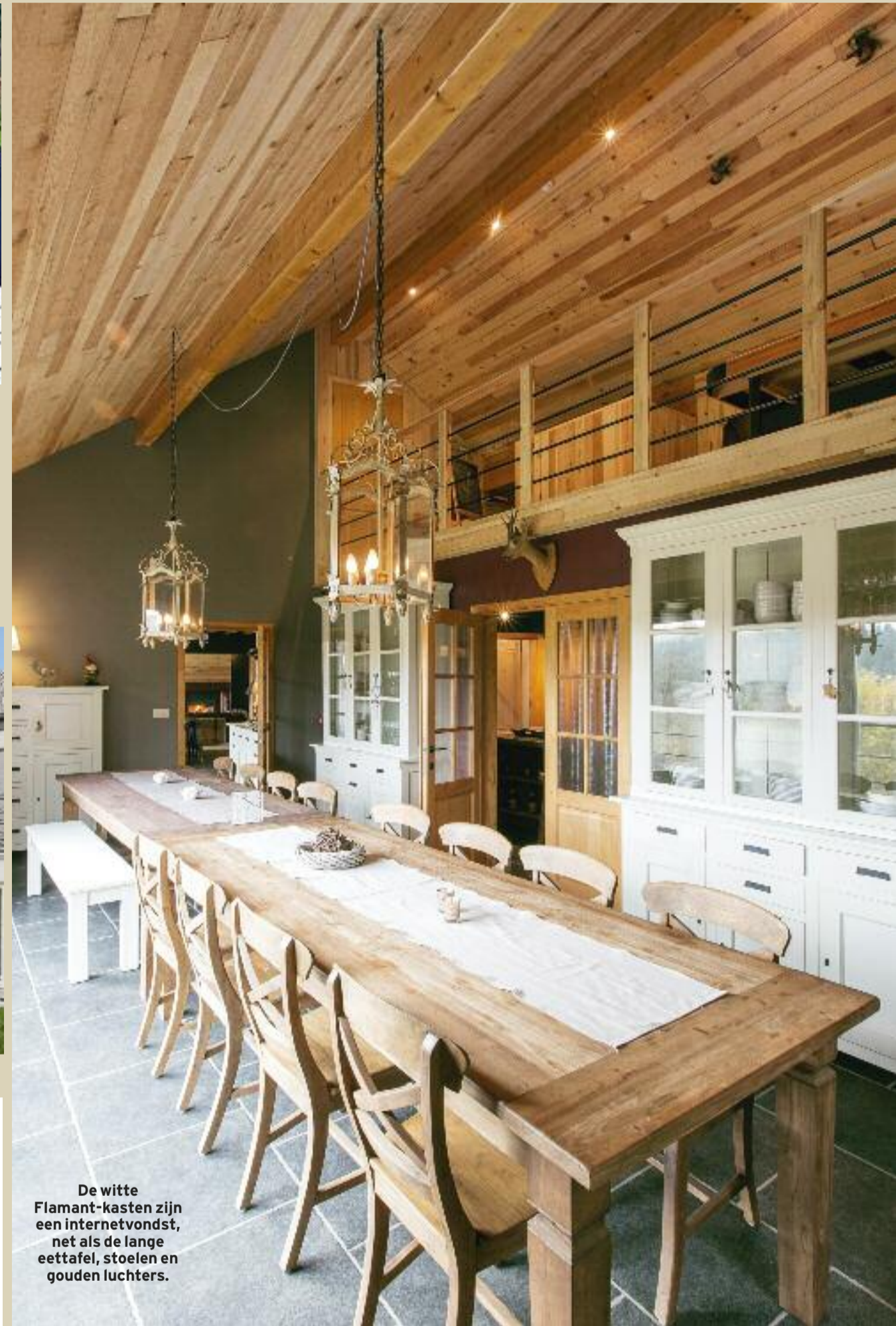
De witte Flamant-kasten zijn een internetvondst, net als de lange eettafel, stoelen en gouden luchters.

Ontelbare uren heeft Dominique op zoekertjes-sites gesleten om de juiste meubels te vinden voor het interieur van zijn Ardense vakantiehuis. En met succes: de landelijke woning is niet alleen tot in het kleinste hoekje aangekleed, je voelt je er ook op slag thuis.