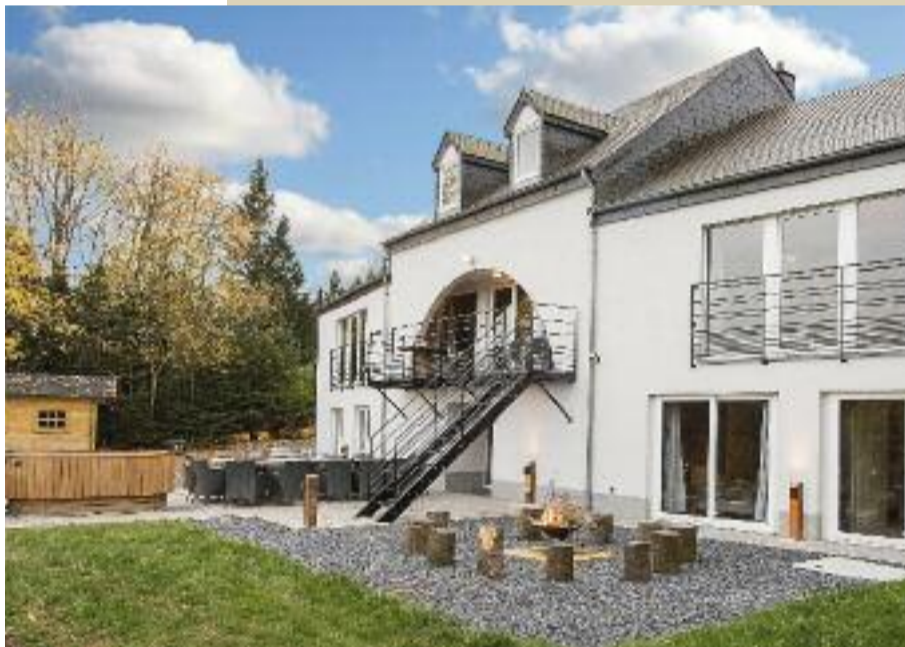
Op het terras bij het huis wacht een hottub en staan stammetjes rond een vuurkorf.

TE HUUR: De vakantiewoning is ook te huur. Ze biedt plaats aan 18 personen. Er zijn zes slaap- en vijf badkamers. Prijsvoorbeeld: 2 t.e.m. 4 december: 1.165 euro of 65 euro per persoon . Boeken kan op www.ardennes-etape.be . De huiscode is 106023-01.